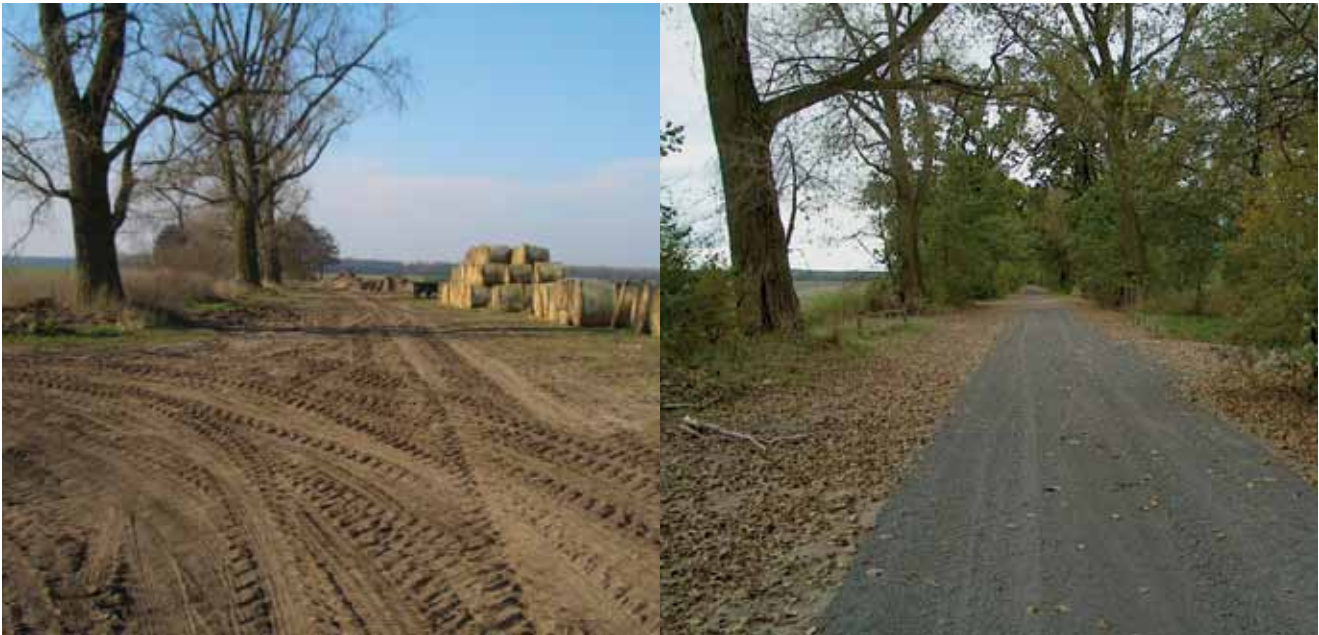
Vietznitzer Weg vor und nach dem Ausbau