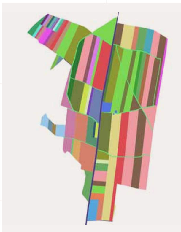
Flurstücke nach der Neuordnung (Teilgebiet Wald)