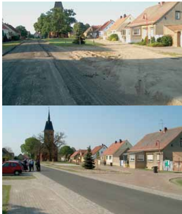
Dorfstraße mit Anger vor dem Ausbau (oben) und danach (unten)

Die Absteckung und Anzeige der neuen Grenzen im Wald erfolgte im November/Dezember 2009. Um die Waldbewirtschaftung bereits im Winter 2009/2010 abzusichern wurde eine vorläufige Besitzeinweisung für das Teilgebiet Wald zum 01.02.2010 nach § 65 FlurbG erlassen.