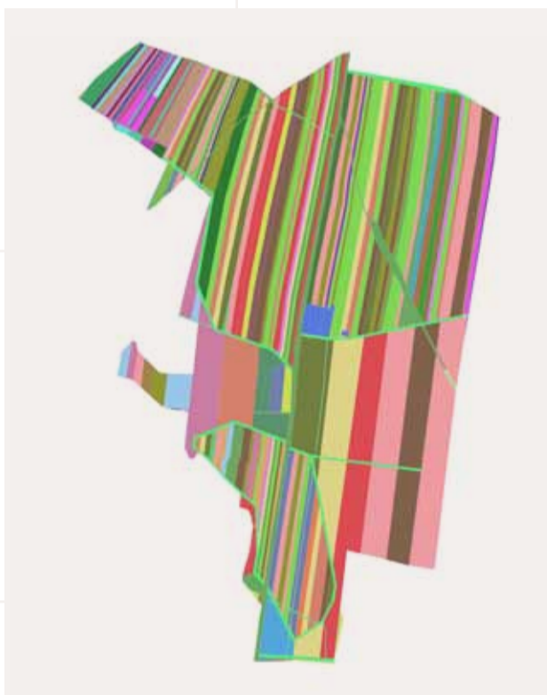
Flurstücke vor der Neuordnung (Teilgebiet Wald)