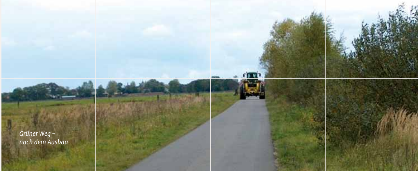
Grüner Weg – nach dem Ausbau

Gesamtausführungskosten 2.583.329,00 Euro Eigenanteil 399.954,00 Euro Fördermittel EU/Bund/Land 2.183.375,00 Euro